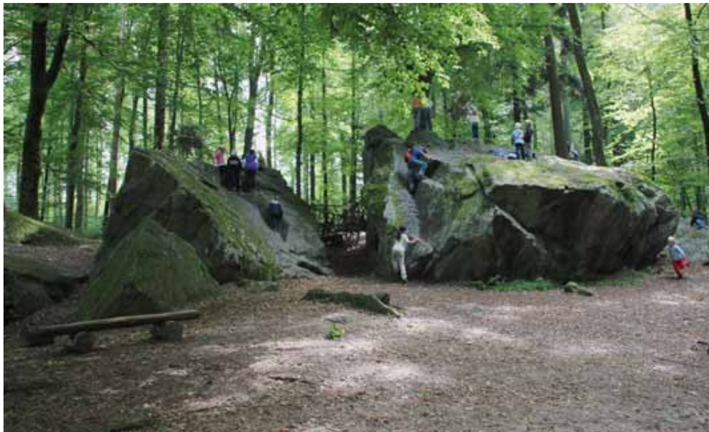
Spielen am Kraftort: Kinder auf der «Tüfelsburdi» auf dem Jolimont.