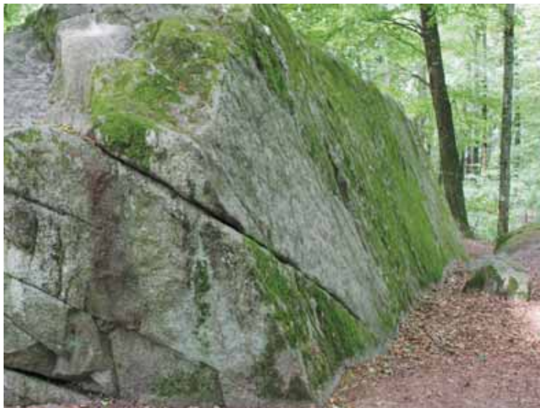
Steil: Auffallend am mittleren Findling der «Tüfelsburdi» auf dem Jolimont ist die grosse Seitenfläche.